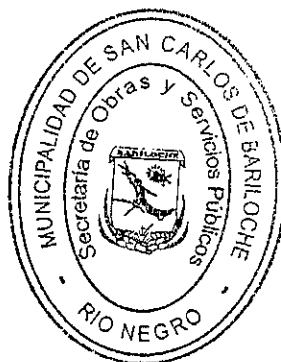
Ing. GUSTAVO GENUSSO Intendente Municipal Municipalidad de S.C. de Bariloche